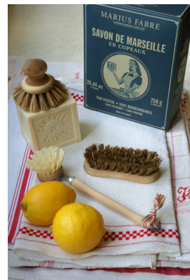
Con pocas cosas se puede limpiar mucho

Menaje : detergente o limón (sobretudo para cristal). Armarios-grasa : agua con bicarbonato. Nevera : vinagre (desodoriza). Lavavajillas (desodorización) : limón (mete en el lavado 2 ó 3 mitades usados). Vitrocerámica : haz una crema líquida con jabón y bicarbonato ( variante : pasta de bicarbonato y agua), ponla en un tarro, vierte un poco en la vitro y limpia como con un producto comercial (extiende con una esponja con palo, rasca la superficie con un rascador para quitar lo quemado, limpia con un paño de microfibra y seca con papel absorbente). Nota : la mezcla se puede usar también para limpiar baños, estufas, fregaderos y cualquier superficie .