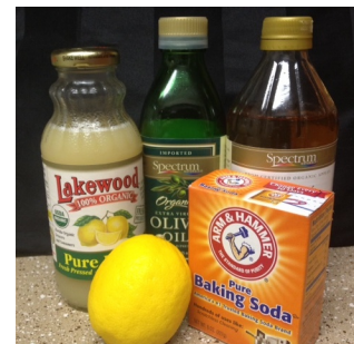
Elementos clave en el hogar: bicarbonato, vinagre, limón, aceite de oliva

Así, por ejemplo, aunque tu aseo y gran parte de la limpieza de tu ropa y hogar se puedan hacer sólo con bicarbonato , también se muestran otras opciones. Recuerda: unos pocos productos, baratos y fáciles de encontrar, solucionan la mayoría de situaciones.