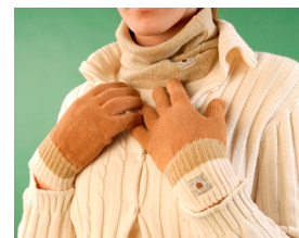
Ropa 100% algodón ecológico sin tintes (Fox Fibre)

Tintes : si hay, vegetales - 24 -. Hilo : en Europa no hay cultivos de algodón bio (por lo que su importación lo encarece) y crear una fábrica de hilo bio es complejo y caro (por lo que apenas hay en el mundo). Algunas empresas bio intentan solventar esta escasez cosiendo sus productos SIN que el hilo sintético toque la piel.