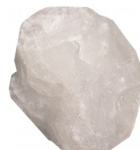
Piedra de alumbre sin pulir

Cuerpo-cara: 1. Aceite (de almendras, oliva o sésamo). 2. Aloe. Cara: Manteca de karité -9- (ejs. Mon Deconatur -10- , Naetura) que se puede humedecer con agua o aceite.