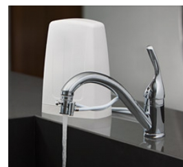
Filtro de sobremesa (Aquasana Mod. AQ-4000)

¿Cuál beber? O mineral en botella de vidrio o agua filtrada o ambas. Mineral: en SQM suele ser apta Bezoya. Stmas. de filtrado -28- : hay personas con SQM que usan el carbón activo (ejs. Aquasana, Carbonit, Brita), otras la ósmosis inversa (con un remineralizador y carbón activo opcionales) y otras las cerámicas (ej. Irisana). También sería de interés probar o la destilación o la técnica GIE -29- . ¿Dónde se ponen? 1. O en el paso general del agua ( integral ). 2. O en salidas específicas cada una con su tipo de filtro -30- (para baño, grifos, viaje, de sobremesa para cocina y lavabos y alcachofas). 3. También hay jarras (de carbón activo). Con esta opción hay quien además hierve el agua.