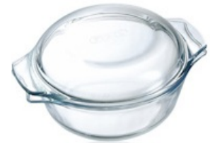
Cacerola redonda de vidrio (Pyrex Classic)

calientes o con aceite, grasa o ácidos (ejs. tomate, limón, vinagre). Tampoco lo uses para congelar -32- . Sartenes: sin teflón/PTFE, ni Quantanium -33- (ej. SKK -34- ). Cacerolas: sin níquel. 1. De vidrio -35- (ejs. Pyrex, Arcuisine, Luminarc). 2. De vidrio cerámico (ej. Pyroflam). 3. De cerámica con titanio y carbón proyectado (SKK). 4. De barro. Cubiertos: de acero inoxidable sin níquel -36- (ej. Pintinox-modelos Touring y Punto. 18/C —en ferreterías—). Tuppers: de vidrio, con tapa o de vidrio o de plástico alimentario incoloro (ejs. Pyrex, Luminarc, botes de comida en vidrio usados —lavar y reutilizar—). Vajilla: de vidrio (ejs. Luminarc, Bormioli Rocco-modelo Acqua, Arcoroc). Recipientes, vasos...: 1. De vidrio (ejs. Bormioli Rocco -37- , Luminarc, Pyrex, Arcuisine, Arcoroc). 2. De silicona platino (ejs. Lékué, Conasi). 3. De barro. Cubiertos de cocina (cucharas, etc.): de madera (para no rayar el recipiente al mover la comida), con o sin barniz (vegetal). Cuchillos-tijeras: 1. De cerámica (ej. Conasi). 2. De acero inoxidable martensítico, o sea sin níquel (ej. Arcos-cualquiera de sus cuchillos sin remaches). 3. De titanio (ej. Arcos-serie Titanio).