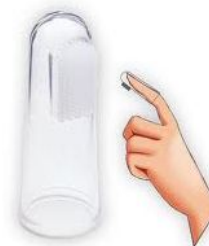
Cepillo-dedal de dientes

Cepillar los dientes, o con bicarbonato o con perborato sódico diluido en agua (usar poco porque al ser abrasivos pueden rayar el esmalte).